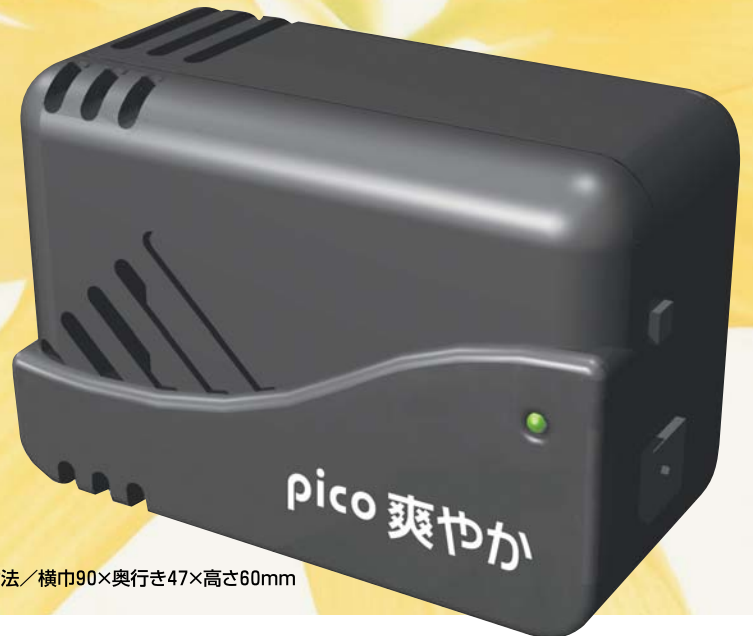
本体寸法／横巾90×奥行き47×高さ60mm