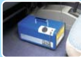
エアコン・車内の悪臭・雑菌を短時間で除去

商品名/型式：剛腕 300CT/GWN-300CT オゾン発生量：300mg/h (20°C60%RH) 吹出口濃度：9.5ppm 電源電圧：DC12V・DC24V (シガレットライターより) AC100~240V 50/60Hz (専用AC電源アダプタより) 消費電力：35W 外形寸法：310(W)×170(D)×140(H)mm (突起物含まず) 重量：3kg 適用場所：自動車内及び室内 使用環境：0~40°C (結露・水濡れなきこと) ※上記仕様及び外観は許可なく変更することがあります。