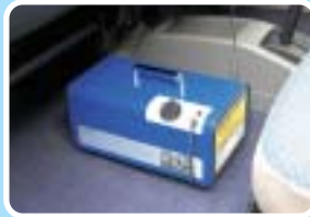
エアコン・車内の悪臭・雑菌を短時間で除去

商品名/型式: 剛腕 300CT/GWN-300CT オゾン発生量: 300mg/h (20°C60%RH) 吹出口濃度: 9.5ppm 電源電圧: DC12V・DC24V (シガレットライターより) AC100~240V 50/60Hz (専用AC電源アダプタより) 消費電力: 35W 外形寸法: 310(W)×170(D)×140(H)mm (突起物含まず) 重量: 3kg 適用場所: 自動車内及び室内 使用環境: 0~40°C (結露・水濡れなきこと) ※上記仕様及び外観は許可なく変更することがあります。